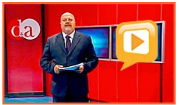
Puntata del 13 gennaio