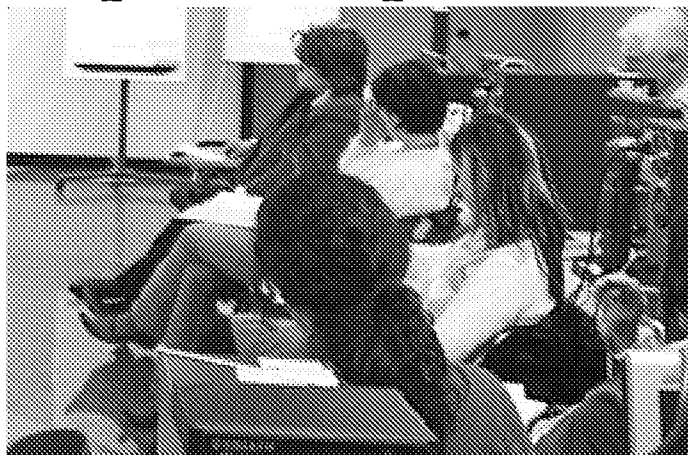
Sarà presente il ministro per le Pari opportunità Barbara Pollastrini