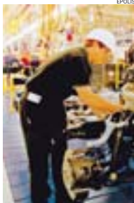
► Fabbriche col bollino blu

gioni, le "Top Ten" sono state riconosciute per la loro capacità di sviluppare percorsi originali e innovativi nella subfornitura meccanica. Un settore che ha grande rilevanza nell'economia regionale con 27mila imprese e 220mila addetti; numeri rappresentano il 70% del settore metalmeccanico. La Cna associa 7mila aziende metalmeccaniche, di cui oltre l'80% sono subfornitrici. ■