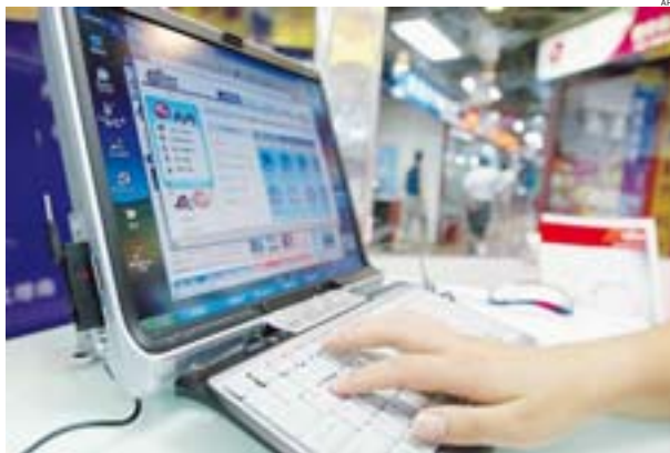
► La truffa corre sulla rete

Il commercio oggi è elettronico, e i truffatori - come era facile immaginare - si sono immediatamente adeguati. E se un tempo, al più, bisognava stare attenti ai falsi ispettori delle Poste o, come insegnavano i vecchi film in bianco e nero, a chi cercava di vendere il Colosseo con annessi e connessi, oggi bisogna adeguarsi e prestare la massima attenzione quando si decide di fare acquisti on line, pagati rigorosamente con la carta di credito.