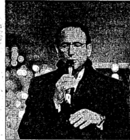
Carlo Conti presenterà il Capodanno

presenza di artisti come Tiziano Ferro. I target di riferimento sono principalmente quelli delle famiglie che prenotano per 2/3 notti con pensione completa e quello dei giovani che prenotano per 2 notti con prima colazione e interesse per lo shopping e il divertimento notturno. E riesce a mirare l'obiettivo anche Cna.com che presenta per il 31 dicembre "Facciamo centro a Capodanno, "idea venuta ascoltando i consigli dei riminesi che vivono quotidianamente il centro storico. La serata di capodanno è sembrata la migliore opportunità per offrire a tutta la città un momento di gioia e divertimento, all'insegna però del rispetto di tutti, in particolare dei residenti. La serata partirà con un aperitivo; continuerà con una cena all'interno dei locali attrezzati, specifichiamo esclusivamente a base di prodotti tipici della nostra