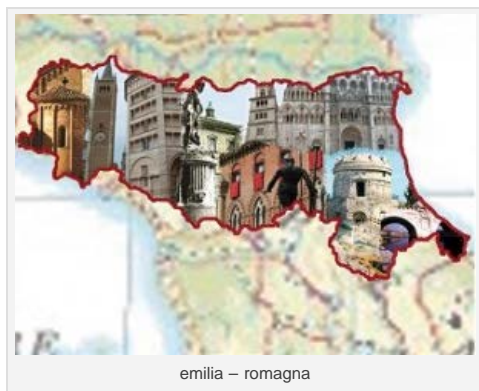
emilia - romagna