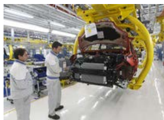
1 di 1 Guarda la foto

Il fatturato (-3,6%) tocca il livello piu' basso dal 2008, crolla l'export con un calo tendenziale del -19%. Gli investimenti, -20,8%, toccano il livello piu' basso dal 2008.