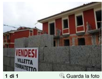
1 di 1 Guarda la foto

(ANSA) - BOLOGNA, 29 AGO - In Emilia-Romagna le costruzioni, dopo un secondo semestre 2012 di lieve ripresa, registrano nel primo trimestre 2013 un calo del fatturato del 18,1%, toccando il livello più basso dal 2008. Emerge dall'analisi dei bilanci di 5.040 piccole imprese fatto da Istat per l'Osservatorio congiunturale TrendER, di Cna. Anche il fatturato complessivo, -10,12%, tocca il livello più basso dal 2008. Solo l'alimentare segna, ormai da 7 trimestri, un dato positivo di fatturato, portando a casa un +2,05%.