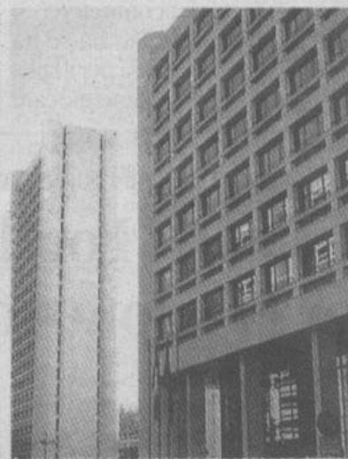
La sede della Regione

Emilia-Romagna e tutte le forze sociali ed economiche», ha commentato Morelli, sottolineando che l'accordo «destinerà oltre 600 milioni di euro per gli ammortizzatori sociali in deroga a quelle imprese, e quindi per i lavoratori, che tenteranno di farcela, e cioè che non avvieranno procedure di mobilità e disoccupazione, ma che useranno le riduzioni di orario, le sospensioni e così via, in una logica di tentare di attraversare la crisi man-