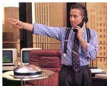
Michael Douglas in "Wall Street"

Il luogo non è stato scelto a caso: quest'anno, infatti, la Cna ha deciso di valorizzare le storie degli imprenditori che rappresentano esempi positivi di successo, anche in quest'epoca di crisi, abbinandole a frammenti di film celebri, tanto che l'iniziativa, promossa da Cna Innovazione in collaborazione con la Cineteca, si intitola " Piccola impresa su grande schermo ". Saranno otto le aziende premiate, su 49 considerate "eccellenti" dopo aver superato le selezioni provinciali, più una menzione speciale conferita da Cna Giovani