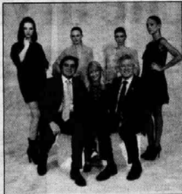
La "sfilata" ripiego con il sindaco in posa