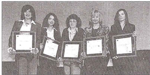
Il gruppo delle imprenditrici premiate a Forlimpopoli