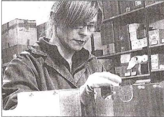
Sempre più "rosa" le imprese associate alla Cna di Forlì-Cesena