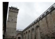
Alla scoperta della Rocca del Duce