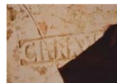
Rimini scopre il suo passato romano