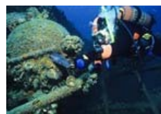
L'oasi subacquea al largo di Cervia