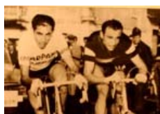
Sport a Ravenna: quando eravamo re