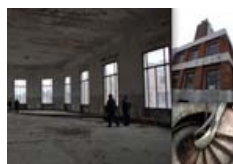
Questa è storia: levate i piccioni