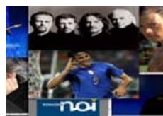
Le interviste di RomagnaNoi.it