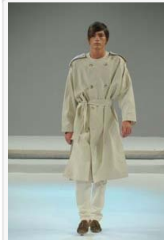
Riccione Moda Italia 2009