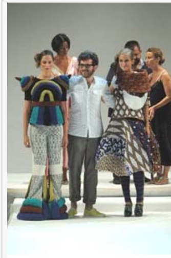
Riccione Moda Italia 2009