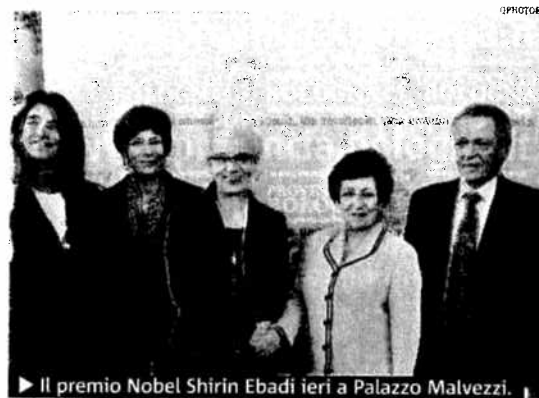
► Il premio Nobel Shirin Ebadi ieri a Palazzo Malvezzi.