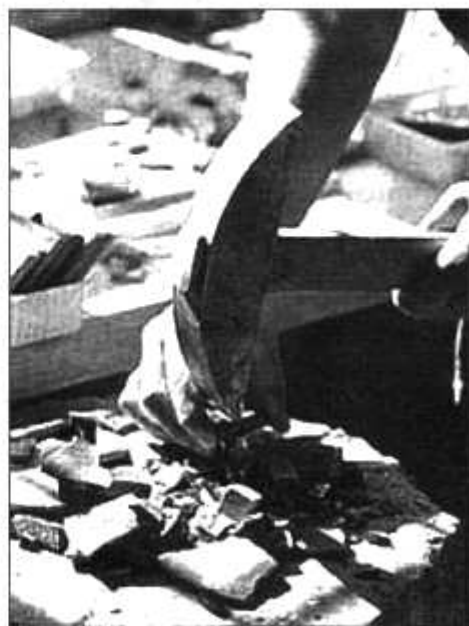
Arte & mosaico

RAVENNA - "L'artigianato artistico nella città del mosaico" è il titolo della mostra, organizzata dalla Cna e dalla Confartigianato, allestita fino al 29 agosto negli spazi dell'Urban Center. In esposizione le migliori produzioni realizzate dagli artigiani della nostra provincia: oltre al mosaico, la ceramica, le opere di restauro, gli oggetti preziosi. Un'occasione unica per i ravennati e per i turisti che visitano la città, di conoscere e apprezzare le opere delle botteghe artigiane.