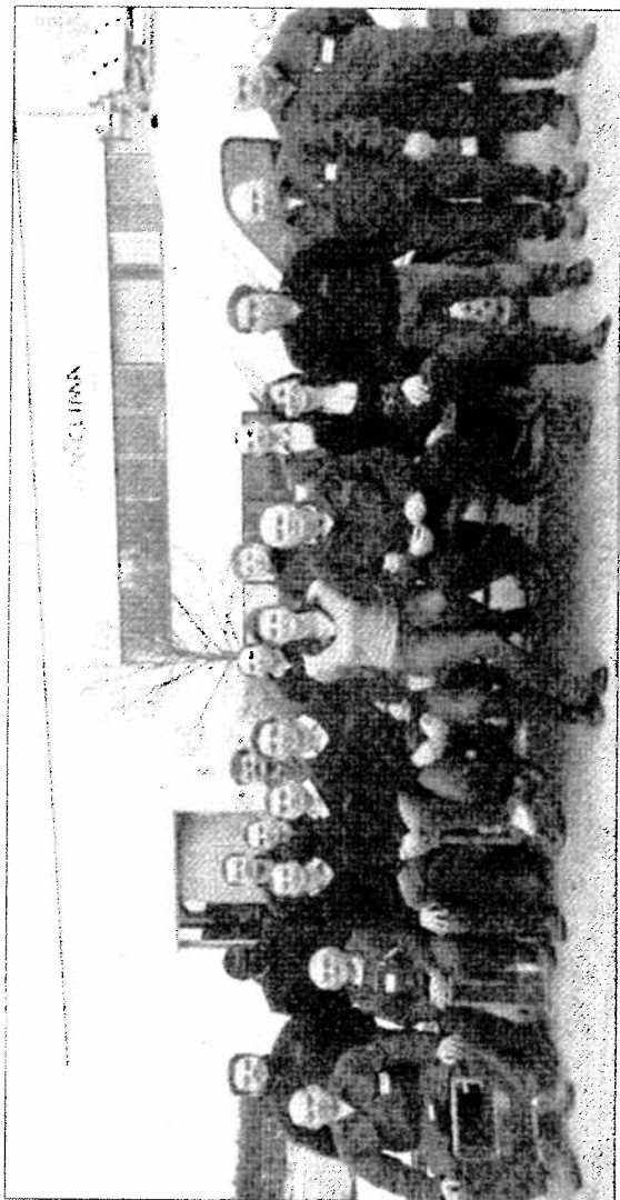
Lo staff dell'azienda