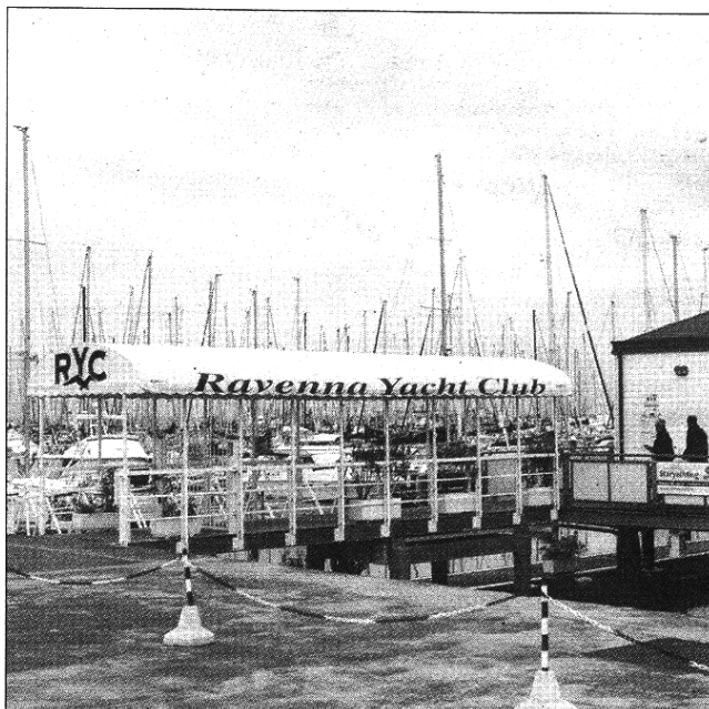
Il Ravenna Yacht Club di Marina

Un momento di dialogo tra imprenditori e ricercatori