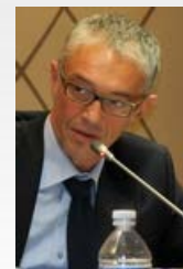
notizia pubblicata il 4/10/2013 da Ermes Ferrari