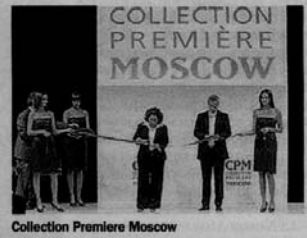
Collection Premiere Moscow

ditizia da parte delle banche, finendo col causare un peggioramento della crisi. Tuttavia le imprese non si arrendono e guardano avanti, proponendosi con prodotti di alta qualità ad un appuntamento mondiale così importante qual'è la vetrina moscovita". Vestire italiano è un patrimonio da difendere e gli imprenditori emiliano-romagnoli lo fanno puntando sulla qualità dei propri capi, la serietà e lo studio di un italian styling, innovativo e ricercato. E la qualità paga.