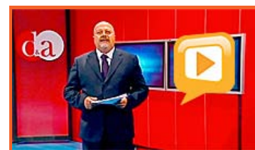
Puntata del 18 febbraio