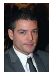
notizia pubblicata il 16/2/2011 da Mirko Valente