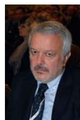
notizia pubblicata il 17/9/2010