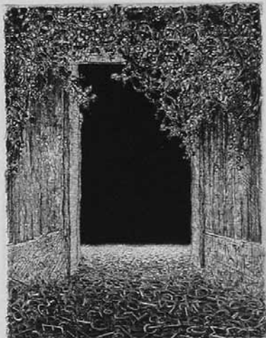
John A. Roebling